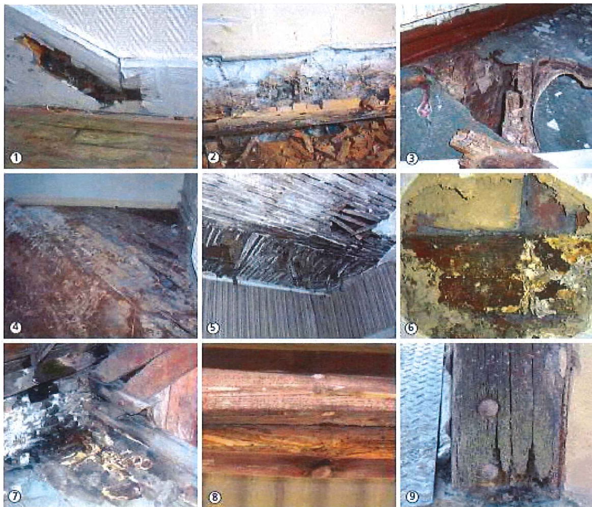
Dégâts occasionnés par le champignon à pourriture cubique Source Anah – Prévention et lutte contre les mérules dans l'habitat - 2006